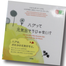
ハグって元気出そうじゃない？