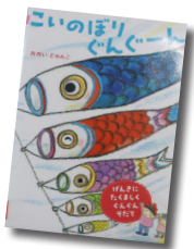
こいのぼりぐんぐーん

10～18時（日曜は17時まで、毎週水曜休館） ※26日（火）は図書整理日のため休館