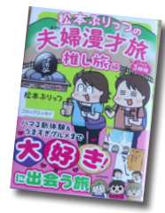
松本ぷりっつの夫婦漫才旅 ときどき3姉妹 推し旅編