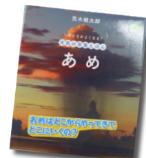
あめ （空となかよくなる天気の写真 真えほん）