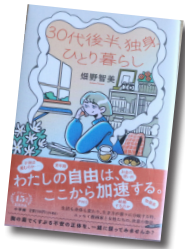
30代後半、独身、ひとり暮らし