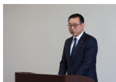
▲新年度町長訓示 （4月1日）

「くっちゃん子をみんなで育てる条例」が制定された。私が町長選でお約束した条例。制定され、ホッとしたついでに、ある一文が私を動かしたことをはじめてここで打ち明けたい。