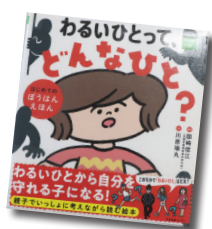
わるいひとってどんなひと？