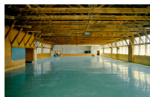
▲旧校舎の屋内体育館