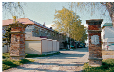
▲向かい合う倶知安小の新旧校舎