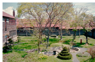
▲中庭 (かつて噴水もあった)