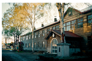
▲旧校舎正面と白樺の木