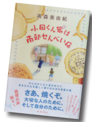
小田くん家は南部せんべい店