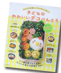
子どものかわいいデコべんとう