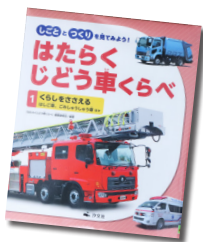
はたらくじどう車くらべ (1)くらしをささえる

10～18時（日曜は17時まで、毎週水曜休館） ※28日（火）は図書整理日のため休館