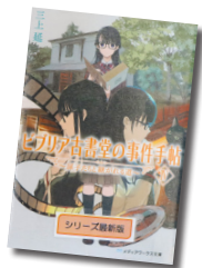
ビブリア古書堂の事件手帖Ⅳ ～扉子たちと継がれる道～

10～18時（日曜は17時まで、毎週月曜休室） ※30日（木）は図書整理日のため休館