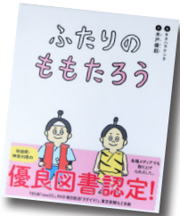
ふたりのももたろう