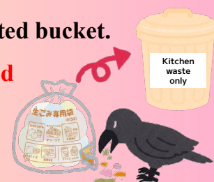
Kitchen waste not placed in a designated bag

Please make sure to put it in a designated bucket.