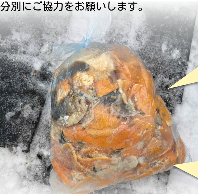
生ごみ専用袋に入れていない生ごみ

最近、写真のような不適切な生ごみの出し方が多く見受けられます。間違った出し方をすると回収されません。ごみステーションの他の利用者の迷惑になりますので、適切な分別にご協力をお願いします。