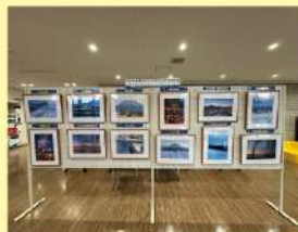
3月実施の役場展示の様子