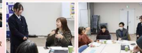
参加者とも積極的に交流いただきました

その後の質疑応答では、高校生目線での地域課題に対する考え方を問う質問が多くあり、普段聞くことができない若い世代の意見を聞くことができました。