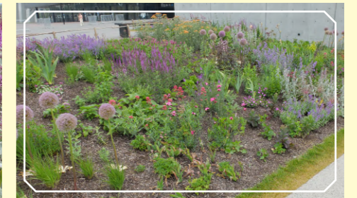
歩行スペースを彩る花群①