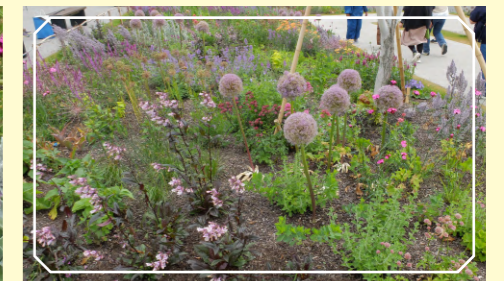
歩行スペースを彩る花群②