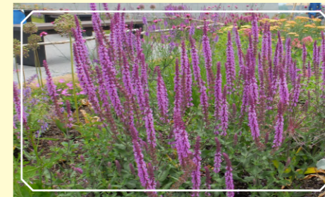
サルビア・ネモローザ