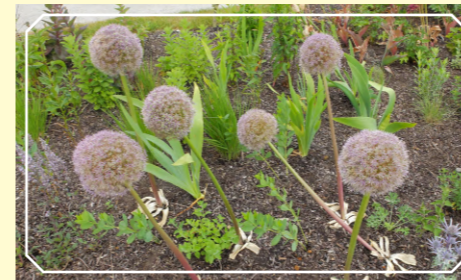
アリウム・スティピタトゥム