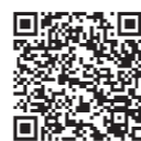
「倶知安町で暮らす」移住パンフレット