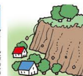
小石がバラバラ落ちてくる

The river water is turbid and driftwood begins to float.