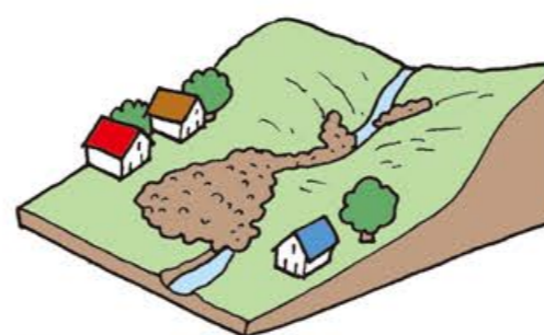
土石流 Debris flow

山腹、川底の石や土砂が長雨や集中豪雨などによって一気に下流へと押し流される現象のことをいいます。