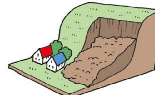
がけ崩れ(急傾斜地の崩壊) Cliff failure (collapse of steep a slope)

It is a phenomenon that river bottom rocks and sediments are washed away all at once to the downstream due to a long spell of rain or local downpour.