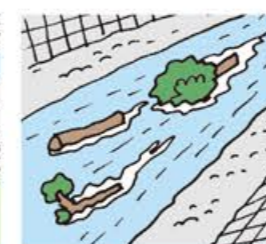
川の流が濁り流木が混ざり始める

The river level drops even though rain is falling continuously.