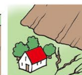
地面にひび割れができる