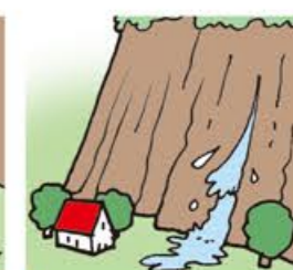
斜面から水がふき出す