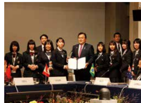
提言書提出の様子 (10月26日パークハイアットニセコ HANAZONO にて)

ESS * ~ English speaking (study) society の呼称で、主に英語活動を行う