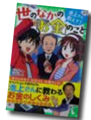
池上さん教えて！ 世のなかの「お金」のこと