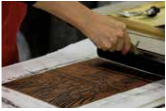
▲『版』にインクをのせる作業。さらに絵の具をのせると多色刷りになる

この日、参加した大人5名は、旅行先で見た風景など、思い思いの絵を描きました。新しい趣味の一つになれば、との思いから参加したという方は、次のように話しています。「彫らない版面は初めての体験。初心者でも難しくなく、カラフルな作品を作ることができているのが面白いと感じました」