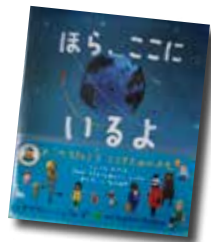
ほら、ここにいるよ