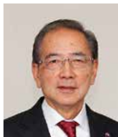
俱知安町議会議長