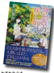
わすれなくさ 勿忘草の咲く町で