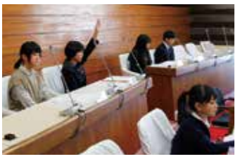
▲「議長！」と挙手する子ども議員。その後、発言台へ移動して発言した。

『子ども議員』となった児童および生徒は、質問から答弁まで、一連の流れを体験することで、町議会や町政への理解を深めました。今回は、暮らした身近な話題から町の将来を見据えたものまで、7つの質問がありました。