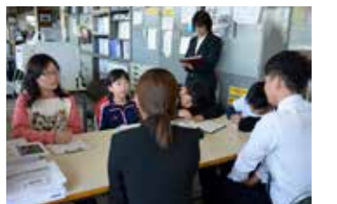
▲役場でのインタビューの様子

俱知安小学校では、授業を通して児童に将来の夢を見つけてもらえればと、6年生が職業について調べる総合学習授業を行っています。5月29日(水)には、人気の職業について調べることを目的に、児童からの希望が多かった職業の中から、俱知安中学校・俱知安幼稚園・町内スーパー・駅周辺にある飲食店・俱知安町役場を5つのグループに分かれて訪問し、実際に働く人に「小学生の時にたかった職業」や「今の職業に就いた理由」などをインタビューしました。今後も修学旅行の際に函館市で同様のインタビューを行うなど、一年を通してさまざまな職業について調べます。