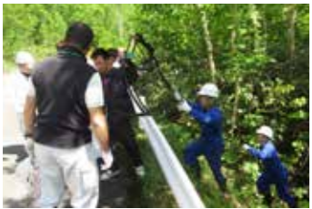
▲不法投棄物の回収作業の様子

この日は、道路脇や林の中に捨てられていた自転車や生活系ごみなど重さ約30kgの不法投棄物が回収されました。