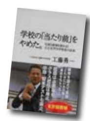
学校の「当たり前」をやめた。