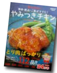
Mizukiのやみつきちキン 簡単・絶品・ご飯がすすむ!