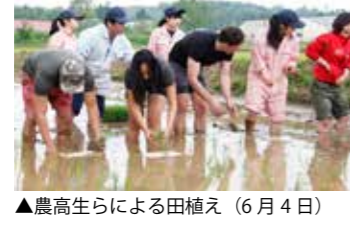
▲農高生らによる田植え(6月4日)

6月4日(火)には、その最初のステップとして同校2年生14名と外国人住民4名が協力して、田植えを行いました。