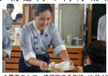
▲農高のカフェで接客する生徒(6月13日)

今年度も同校敷地内で営業します。6月10日(月)、店内では13日(木)のオープンに向けた準備が進められ、同校2・3年生がカフェの店員となつて、来店した1年生を相手に、接客の練習を行いました。