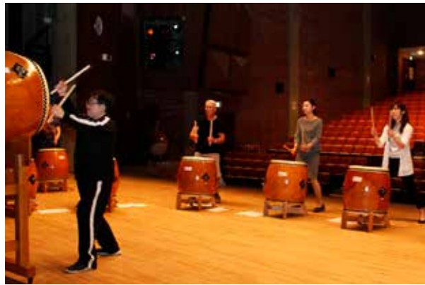
▲羊蹄太鼓講座の様子