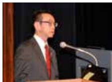
▲ G20 国際シンポジウム (5月24日)