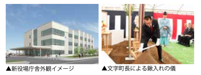
▲新役場庁舎外観イメージ ▲文字町長による鍬入れの儀

今後、現庁舎を利用しながら工事を進め、新庁舎は令和3年ゴールデンウィーク明けからの利用を予定しています。工事期間中は、ご不便をおかけしますが、ご理解とご協力を願います。