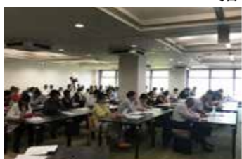
▲説明会の様子(6月3日)