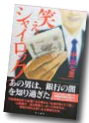
笑え、シャイロック