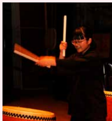
くっちゃん羊蹄太鼓保存会 鼓流のメンバー

太鼓のイベントなどでは、多くの人と話す機会があり、他団体の同年代の人とも仲良くなることのできるため、うれしいです。最近は褒められることやできることが増えてきたため、太鼓をしていてすごく楽しいです。大人になっても今と同じように太鼓を続けていたいと思います。