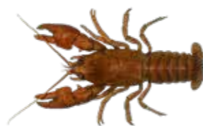
絶滅危惧種Ⅱ類 ニホンザリガニ