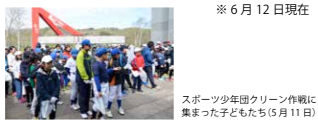
※6月12日現在 スポーツ少年団クレーン作戦に集まった子どもたち(5月11日)

ご協力ありがとうございました ○全54団体・町内会 ○参加人数 2,705人 (大人 2,300人 子ども 405人) ○ごみ総重量 4,120kg