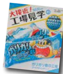
大接近!工場見学(2) ガリガリ君の工場