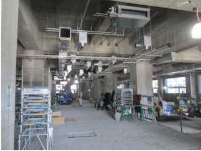
配管工事の様子(1階)

・空調設備のダクトや給排水、電気の配管などの配管工事が進められ、会議室など各室の間仕切り壁を設置するための下地材(軽量鉄骨)の組み立てが始まりました。