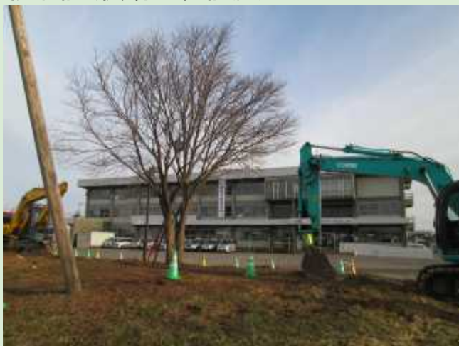
移植前(役場庁舎前庭)