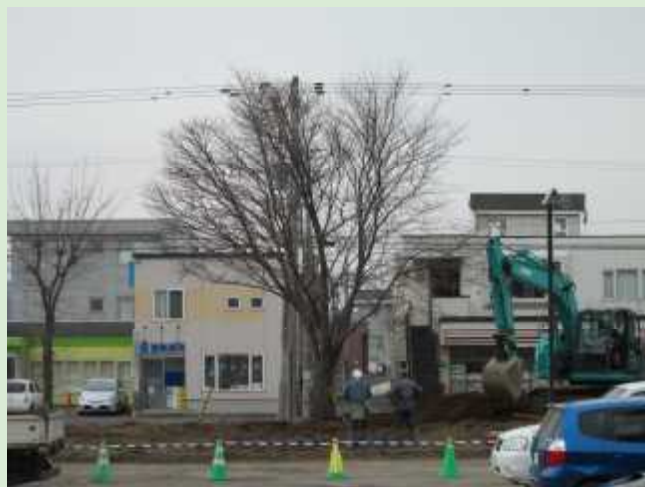
移植後(どんぐり公園)