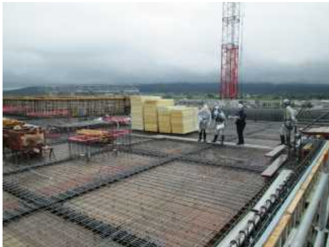
3階床スラブ配筋検査の様子