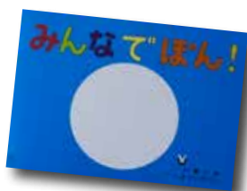
紙芝居 みんなでぼん！

※8月13日（月）～15日（水）はお盆のため、28日（火）は図書整理日のため休館