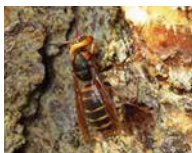
▲アカウシアブ（左：硫黄川沿いの湖畔林にて）とモンスマバチ（右）