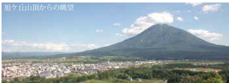
旭ヶ丘山頂からの眺望

ます。無理をせず安全に登山を楽しみましょう。 倶知安町の周辺の山々は、それぞれ特徴的であり、さまざまな表情を持っています。普段はご自宅や、通勤通学時に当たり前に目にする山ですが、その上に立ち、私たちの暮らす町を、いつもと違った視点で眺めてみることで、新たな発見があるかもしれません。 自然に囲まれた中でしか味わうことのできない、非日常の時間を楽しみましょう。