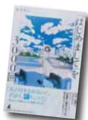
「はじめまして」を3000回