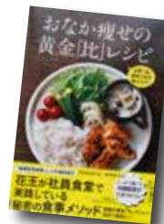
おなか痩せの 黄金「比」レシピ