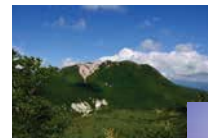
▼別所川とニセコの山々

イワオヌブリとニセコ連峰の主峰ニセコアンヌブリは、町のこれまでの歴史の中で非常に重要な役割を果たしてきました。イワオヌブリでは、明治から昭和の初めにかけて硫