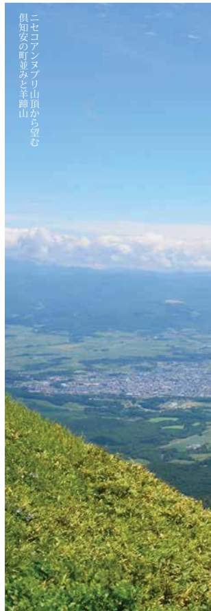
ニセコアンヌブリ山頂から望む 倶知安の町並みと羊蹄山

黄掘が盛んに行われ、最盛期には200人以上がそこに住み、地域経済を支える存在でした。その採掘量が減少し始め、閉山を迎えてから二十数年後、ニセコアンヌブリにスキーリゾートがかかり、現在に続くスキーリゾートとしてのニセコの歴史が始まります。 ニセコアンヌブリ山頂では、太平洋戦争中に軍用機の着氷実験が行われていました。現在この機体の主翼の一部を風土館で一般公開しています。 また、このほかにも倶知安町の周辺には大小さまざまな山があり、それぞれが多彩な魅力を持っています。