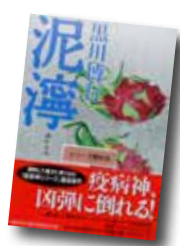
泥濘 (疫病神シリーズ7)