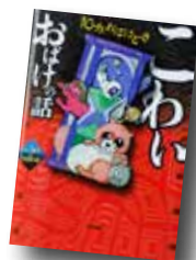
こわいおばけの話