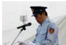
▲平成30年消防演習にて（6月23日）

6月7月の低温、長雨、日照不足、さらには台風の影響で記録的な大雨となりクトサン川上流が氾濫したことにより、北部地区の農地が冠水し、農作物にも甚大な被害が出ており、今後の生育や収穫量が心配されるところです。