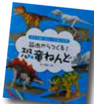
筋肉からつくる！ 恐竜ねんど