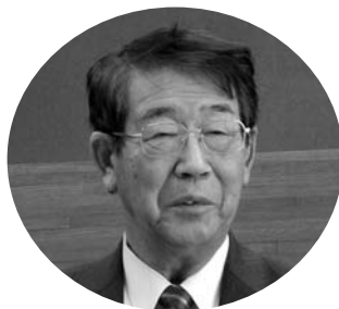
原田 芳男 議員