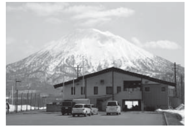
△サンスポーツランド

△役場正面玄関に俱知安駅開業までの月数を示したカウントダウンボードが設置されました