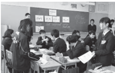
△高校生が中学生に英語で質問する様子

このように答えてくれた高校生を見ると、この事業を実施してきたこの1年間は、小中高の連携を深めるといふ目的に加えて、年齢、学校、地域の枠を超えて交流を深めることで、子どもたちの成長を大きく促すことにつながったのだと感じました。