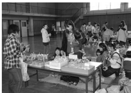
わんぱくスポーツクラブバザー

新規会員募集(後期) 親子で楽しく遊んだり、親同士で情報交換をしてみませんか。町内には活動内容が似ている団体が2つあり、それぞれ趣向を凝らした取組みをしています。両クラブでは次のとおり会員募集をしていますので、この機会にぜひ参加してみてくださいいかがですか。