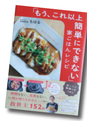
「もう、これ以上簡単にできない」家ごはんレシピ