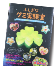
ふしぎなグミ実験室 作って食べて 科学のナゾを おいしく解き明かす！