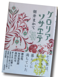
グロリアソサエテ