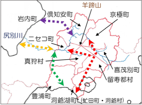
▲虻田郡と各地アイヌの活動範囲