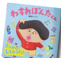
わすれぼんたくん